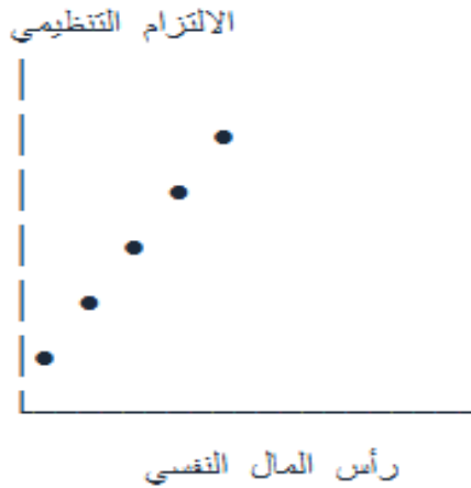
الشكل (3): التمثيل البياني للعلاقة بين رأس المال النفسي والالتزام التنظيمي

يهدف هذا الشكل إلى توضيح الاتجاه العام للعلاقة بين رأس المال النفسي والالتزام التنظيمي، كما كشفت عنه نتائج تحليل الارتباط والانحدار الخطي. ويُستخدم هذا النوع من الرسوم (Scatter Plot) مع خط اتجاه لإظهار ما إذا كانت العلاقة بين المتغيرين طردية أو عكسية، وكذلك لتوضيح درجة اتساق البيانات حول خط الاتجاه العام.